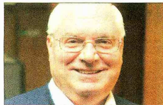
INFOTOP EL DÍOSES

“El reponer la indicación posibilita que se puedan llevar adelante los proyectos educativos”.