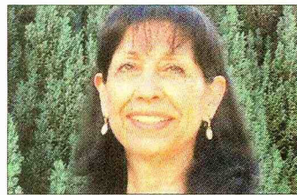
COLEGIO MONTESSORI DE TALCA

“Lo más importante es la libertad de los papás de elegir un colegio, que por algo escogen cierto proyecto educativo”.